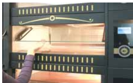
5. Heben Sie die Glasscheibe am unteren Rand an