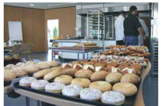
Testbacken mit SSP