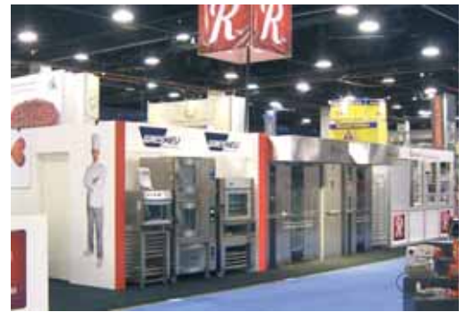
IBIE, Las Vegas