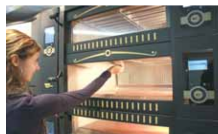
2. Greifen Sie die Glasscheibe am unteren Rand und ziehen Sie diese nach vorne