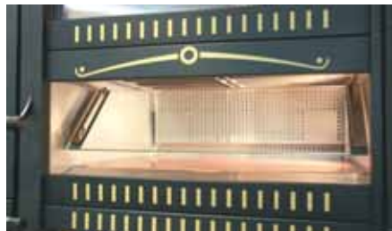
4. Die Innenseite der Glasscheibe lässt sich einfach und bequem reinigen