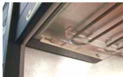
7. Schieben Sie die Glasscheibe nach hinten und wieder zurück nach vorne. Die Türe rastet ein.