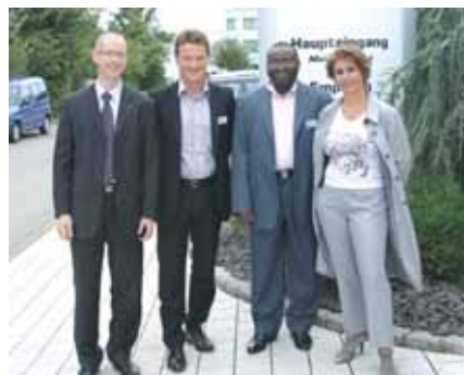
Lesaffre aus Frankreich zu Gast