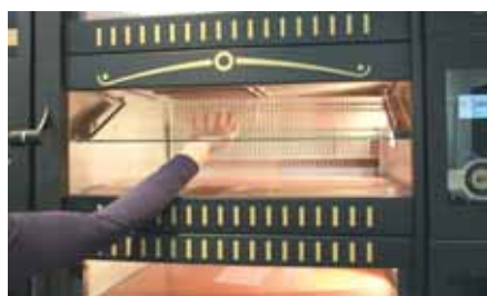
6. Schwenken Sie die Glasscheibe nach oben