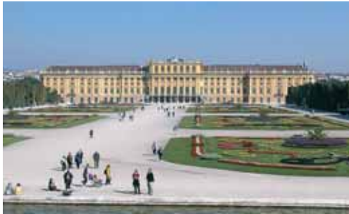
Schloss Schönbrunn, luxuriöse Sommerresidenz der Habsburger