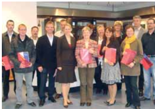
Service, Vertriebsinnendienst, Einkauf, Zentrale

Auch die Frage nach der korrekten Businesskleidung wurde erörtert – also meine Herren, auch wenn der Sommer noch so heiß wird – keine kurzärmeligen Hemden mit Krawatte! Auch die kurze Hose hat im Büro nichts zu suchen. So lautet zwar der Knigge, aber leider sind Ausnahmen die Regel. Nach dem Seminar ging es nach Ludwigsburg ins Hotel, danach ließen wir den Abend in einer Hausbrauerei mit leckerem Bier und Essen ausklingen.