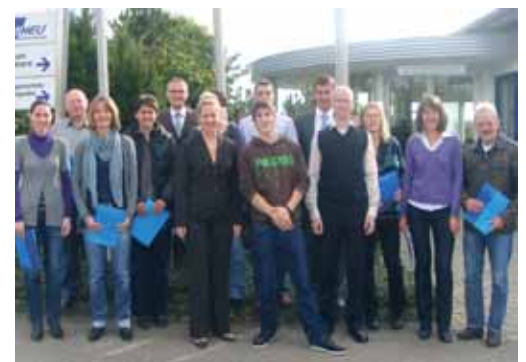
Service, Vertriebsinnendienst, Einkauf

Angesprochen waren in dieser ersten Seminarstaffel unsere Azubis, die Außendienstmitarbeiter sowie Service- und Vertriebsmitarbeiter vom Innendienst. Allgemeines Fazit des Semi-