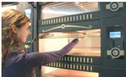
3. Die Glasscheibe wird entriegelt und kippt vorne herunter