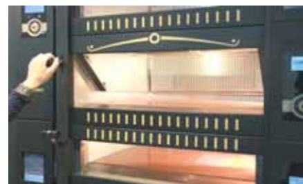
8. Schließen Sie die Ofentür