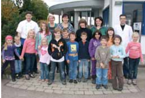
Gruppenbild der Kernzeitkinder