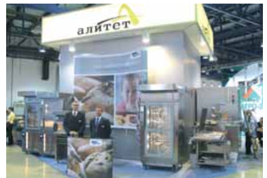
Modern Bakery, Moskau