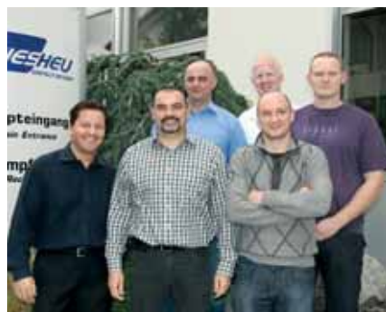
IS Grundschulung für AVM, Belgien und Hornbaekel, Dänemark