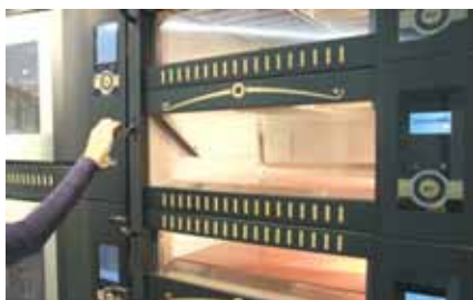
1. Öffnen Sie die Ofentür und ziehen Sie diese nach vorne

Hier die Anleitung in einzelnen Schritten mit Bildern: