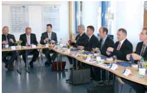
Der Außendienst beim Serviettenfalten