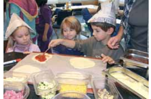
Konzentriert bei der Arbeit