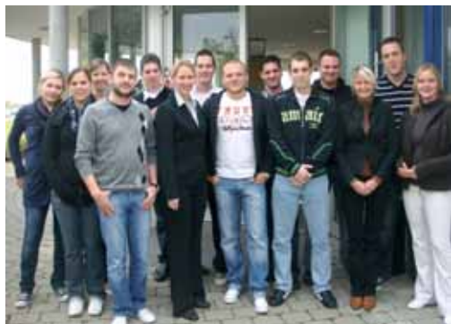
Azubis und Ausgelernte