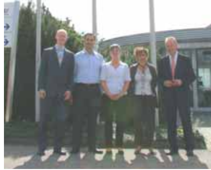
Die Holder Groupe aus Frankreich zu Besuch