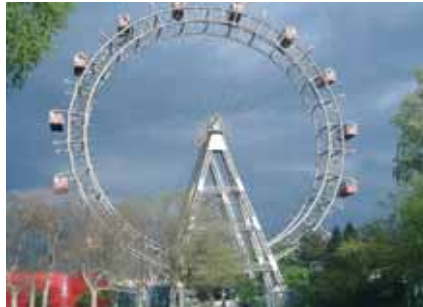
Das Riesenrad, eines der Wahrzeichen Wiens und des Praters

Die Altstadt Wiens, die von der Habsburger Regentschaft geprägt ist, sowie das Schloss Schönbrunn wurden von der UNESCO als Weltkulturerbe anerkannt. Der Stephansdom ist neben dem Riesenrad im Prater und anderen Sehenswürdigkeiten ein Wahrzeichen Wiens. Größter musealer Komplex in Wien ist die kaiserliche Hofburg. Sie gehört ebenfalls zu den Wahrzeichen der Stadt. Der große Gebäudekomplex, der im