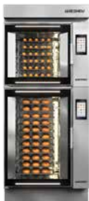
E3 SL con sistema de carga