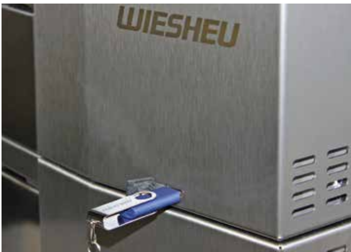
Programowanie sterowania przez USB