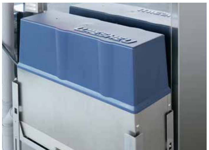
W pełni automatyczny system czyszczenia ProClean365