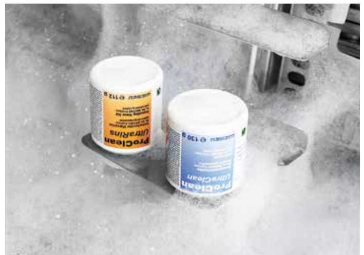
Automatyczny system czyszczenia ProClean